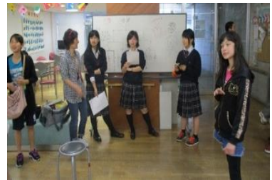
接戦を勝ち抜いた今回の優勝者です！