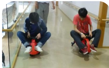
白熱のレース！勝つのはどっちだ!?