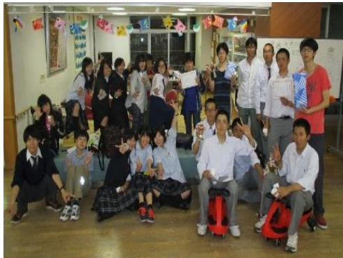
皆で集合写真！楽しかったよ～