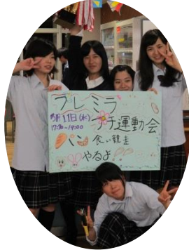
今回の企画者＆友達です