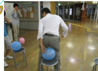
上手に割れるかな??