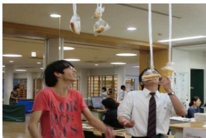
苦戦っ！パン食い競争！！