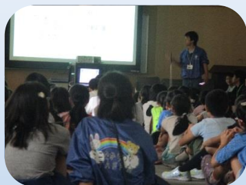
パワーポイントでまちの説明中