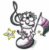
ミニづかイメージキャラクター キラリちゃん

*中高生のみなさんは近隣の児童館、子ども館で申し込み用紙 をもらって下さい。配布は11月28日(月)からです。