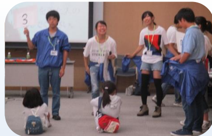
緊張している子にも 気さくに話しかけています

10月2日(日)に中高生スタッフと小学生の子どもリーダーが初顔合わせをしました。今年は中高生が26名、小学生が110名集まりました! 中高生スタッフからのまちづくりの説明のあと遊びを通してチームの仲を深めました!