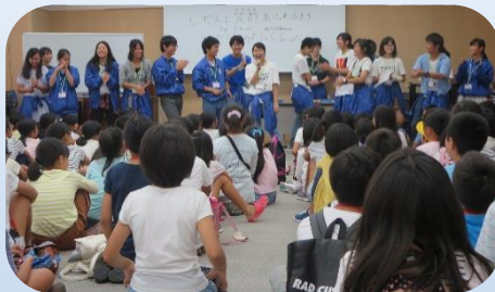
みんなで自己紹介です