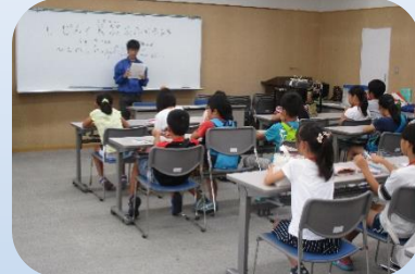
人前で上手く話せるかな?