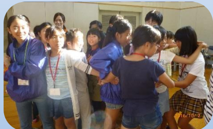
ミニゲームを通して仲良くなったよ! 各ブースの説明をしています