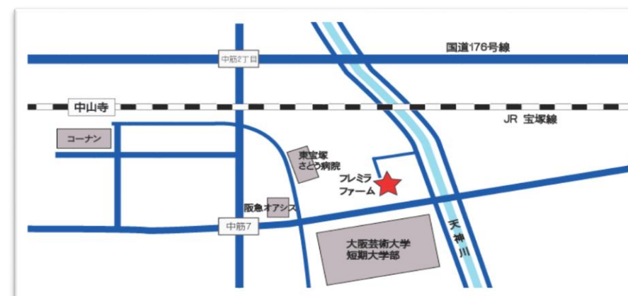
フレミラファーム地図

<園芸福祉コースについて> ・フレミラファームへは、徒歩・自転車バイクに限る。 ・実習は、長袖長ズボン・帽子・手袋・長靴を持参。道具は貸出あり。